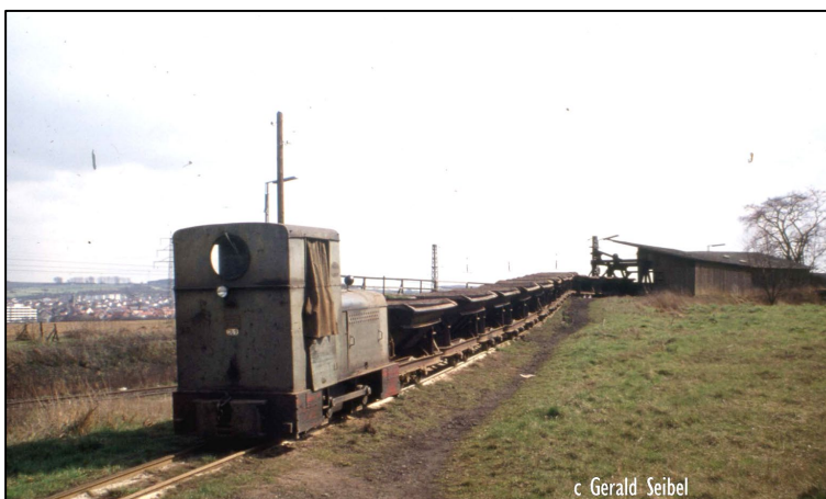
Abb. 1: Rampe der Feldbahn zur Verladestelle.

Der räumliche Geltungsbereich der Änderung des Flächennutzungsplanes liegt auf der Westseite der Main-Weser-Bahn, die in der allgemeinen Wahrnehmung Großen-Linden und Leihgestern trennt. Der Abschnitt Gießen-Langgöns der Bahnstrecke 3900 wurde im Jahr 1852 eröffnet. Nördlich des heutigen Bahnhaltepunktes befand sich eine Erzverladestelle. Die beiden folgenden Aufnahmen der Feldbahnzufahrt und der Erzverladestelle mit Schüttwand sind dem Internet-Forum „Drehscheibe“ entnommen und werden hier mit freundlicher Genehmigung des Fotografen vom 11.07.2020 abgebildet.