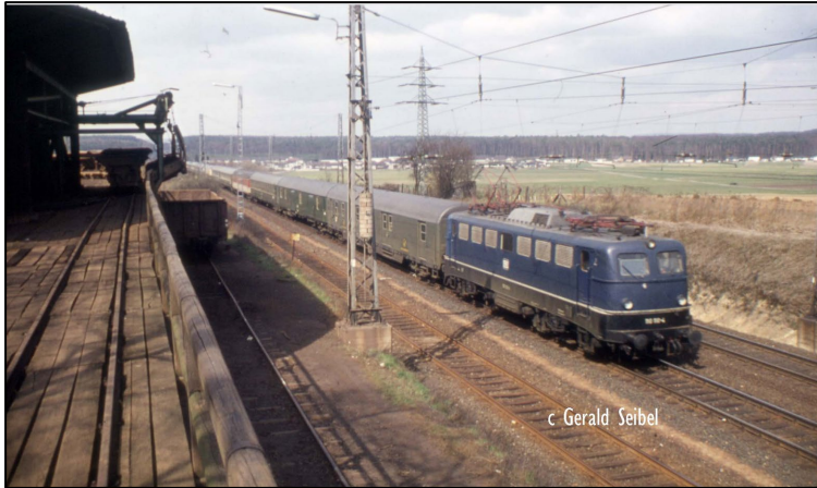
Abb. 2: Blick von der Verloaderampe nach Norden.

Im Bildhintergrund ist der Stadtteil Forst erkennbar.