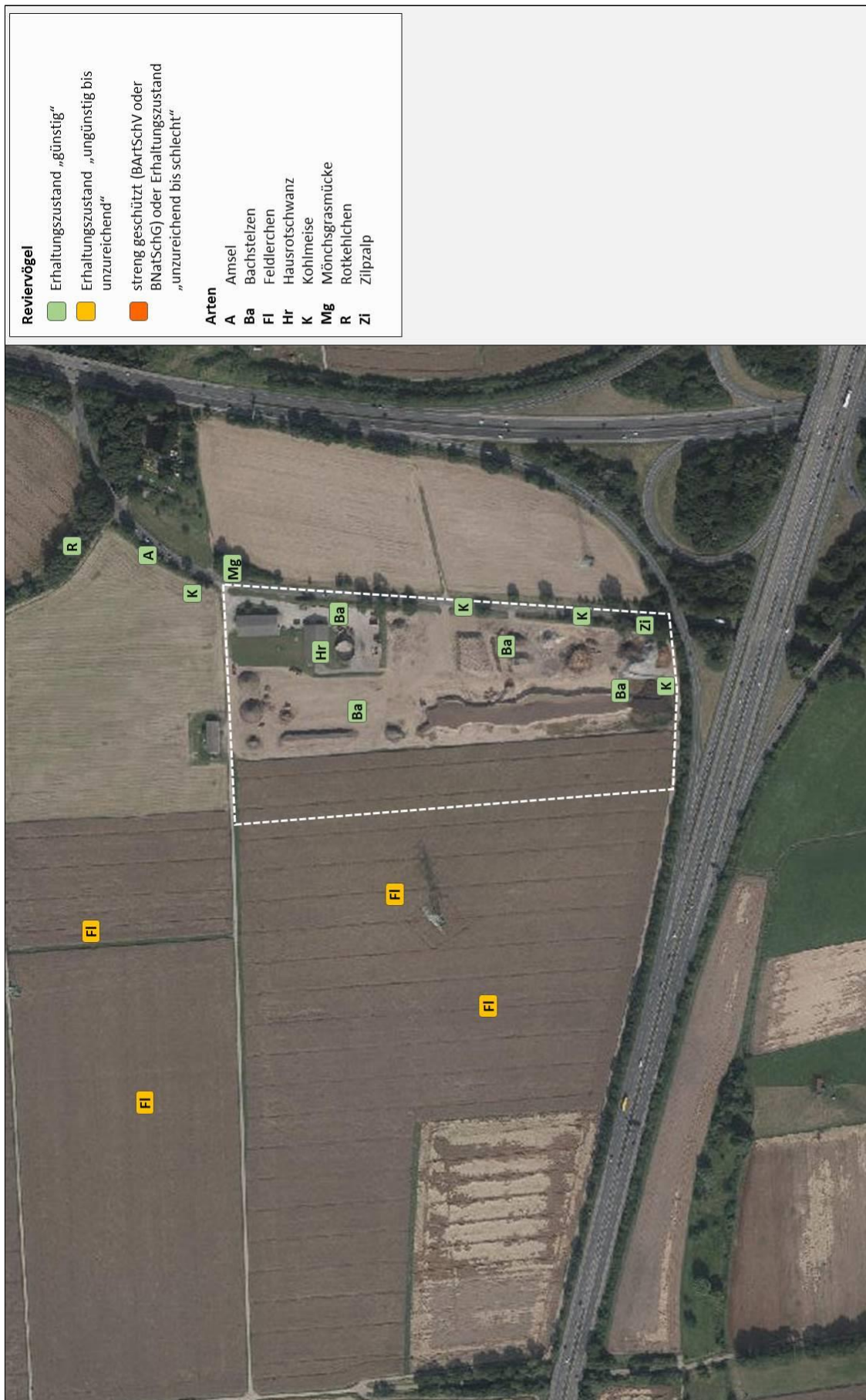
Abb. 2: Reviervogelarten im Planungsraum 2019 (Bildquelle: Hessisches Ministerium für Umwelt, Klimaschutz, Landwirtschaft und Verbraucherschutz, aus natureg-hessen.de, 05/2019).