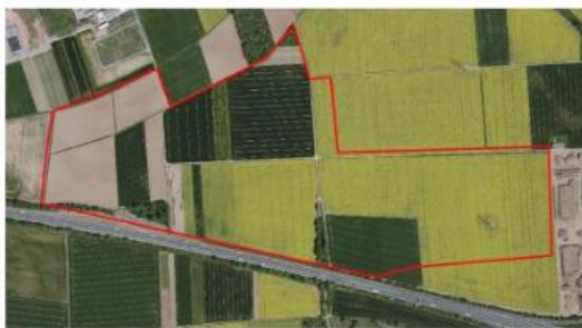
Darstellung in der SUP 2021