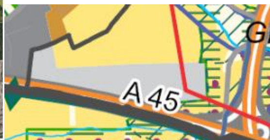
Darstellung Regionalplan 2021

In der Stellungnahme der Stadt sollte auf die Diskrepanz des Flächenzuschnitts in 2021 hingewiesen und auf S. 15 berücksichtigt werden; denn auf welche Darstellung nimmt die Stellungnahme der Stadt Linden in der Betrachtung der Anträge zum RPM 2021, Bezug?