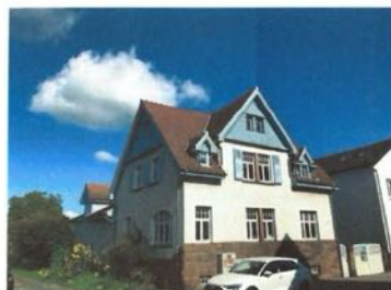
Breiter Weg 47, Zustand 2023

Das Gebäude wurde im Zuge der historischen Ortserweiterung Richtung Bahnhof an der ehemaligen Bahnhofstraße (heute Breiter Weg) errichtet. Das traufständige Wohngebäude mit Satteldach und drei zu zwei Fensterachsen weist eineinhalb Geschosse sowie ein durchgängiges Zwerchhaus auf. Das Gebäude ist verputzt, der Sockel in Rotsandstein-Rustika ausgeführt. Straßenseitig befinden sich zwei verschindelte Gauben. Ein- bis vierfüßige Rechteckfenster im stehenden Format, im Westen eines mit Segmentbogenabschluss, mit sprossiertem Oberlicht. Die Mittelachse des Zwerchhauses wird durch sandsteinerne Mittelpfosten zwischen den Fenstern hervorgehoben. Dem Eingang im Osten ist eine hölzerne Vordach-Konstruktion mit steilem Satteldach vorgelagert. Die verschindelten Giebel und Gauben, Fensterläden sowie Trauf- und Ortgangverschalung sind als prägende gestalterische Elemente erhalten. Im Innenbereich sind der Fußbodenbelag sowie bauzeitliche Ausstattungselemente, wie floraler Deckenstuck, Türblätter- und zargen und ein verziertes Treppengeländer, die vereinzelt Jugendstil-Ornamente aufweisen, erhalten.